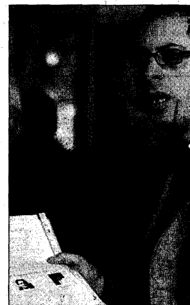
La conferenza al caffè Gambirinus

“Ringrazio i carabinieri, gli unici che si sono sempre mossi coerentemente nella lotta all'abusivismo”